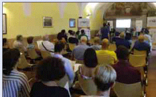
Il work conference promosso dalla Fondazione Eni Enrico Mattei (Feem)

Forte, ha relazionato su "a'Naca Basilicata. La sfida sociale per la sostenibilità". Forte ha spiegato il significato del marchio ombrello a'Naca Basilicata (la culla), che racchiude i 42 progetti che sono stati elenca-