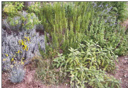
Alcune piante officinali