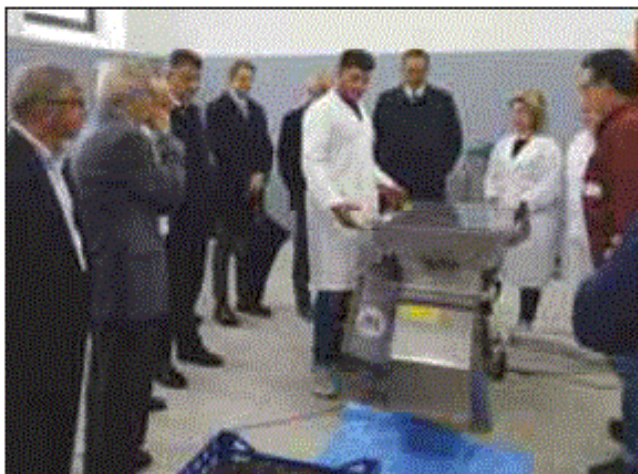
Alcuni momenti dell'incontro di presentazione

SANT'ARCANGELO - Lunedì scorso, è stata inaugurata all'Istituto Agrario "Giustino Fortunato" di Sant'Arcangelo, la cantina sperimentale di vinificazione. Si tratta di opportunità di crescita congiunta dell'innovazione e della ricerca nel settore vitivinicolo, quasi unica nell'intero panorama nazionale. "Oggi si inaugura un laboratorio molto importante che segna il passo per un'ulteriore e importante attività di sperimentazione che, si terrà nella scuola agraria e che sarà un'ulteriore fiore all'occhiello per la formazione dei nostri giovani, oltre che a fornire un servizio sul territorio che è cosa poco diffusa in tutta la nazione - ci racconta il dirigente scolastico, Rocco Garramone -. In qualità di dirigente scolastico di questa scuola sono felice che si avvii questa sinergia, tra l'altro voluta fortemente dal presidente della Regione Pittella e dalla fondazione "Enrico Mattei". E proprio il presidente Pittella che ha raggiunto la città valdagrina per osservare di persona gli studenti all'opera per la prima volta in questo nuovo laborato-