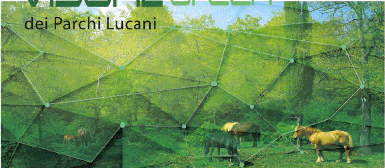
grafico: Topograph - elaborazioni: a'NACA