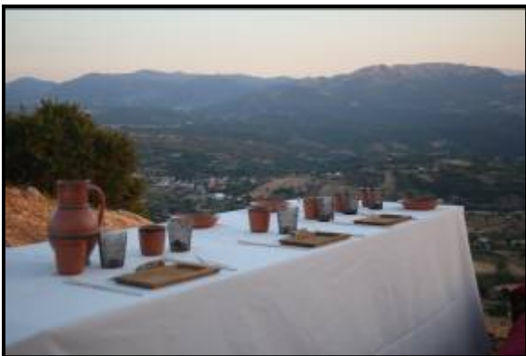
Foto: alcune immagini dell'evento "Il Banchetto del Conte Goffredo", tenutosi a Satriano (PZ)

Il progetto, attualmente in corso, si concluderà nel 2019.